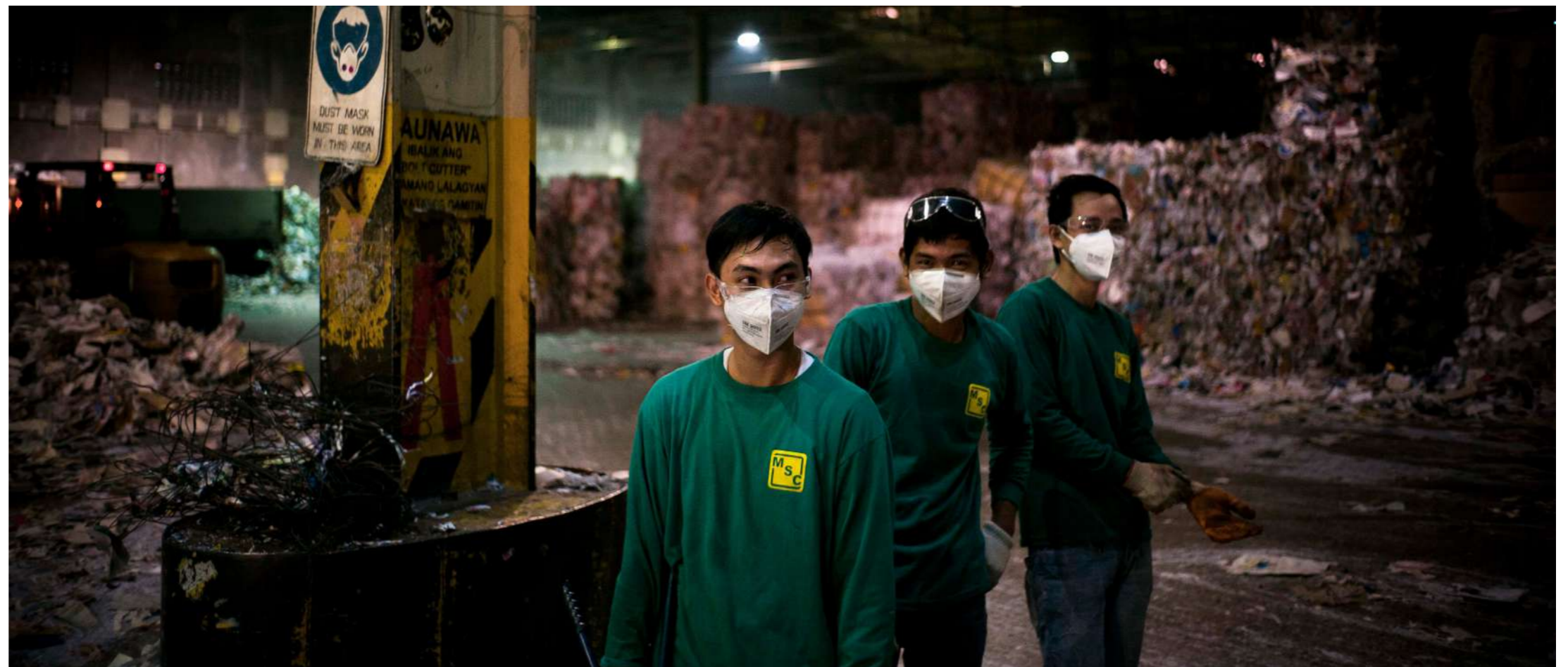
Nuevos trabajos “verdes” - pero son decentes? Los trabajadores filipinos que reciclan plástico en San Fernando se exponen a químicos.

Los sindicatos temen que los sectores nuevos y privatizados sustituyan a las industrias sindicalizadas, con lo que se perderán los avances logrados en favor del empleo digno durante décadas de lucha sindical. Una idea es fortalecer las cooperativas de trabajadores. Otra ha sido garantizar que las empresas locales más pequeñas puedan participar a nivel municipal. La competencia local y centrada en los trabajadores es necesaria frente a las enormes y bien financiadas empresas multinacionales que ya están invirtiendo en energía local y energías renovables, y contra las que las operaciones más pequeñas no pueden competir sin algún tipo de protección gubernamental.