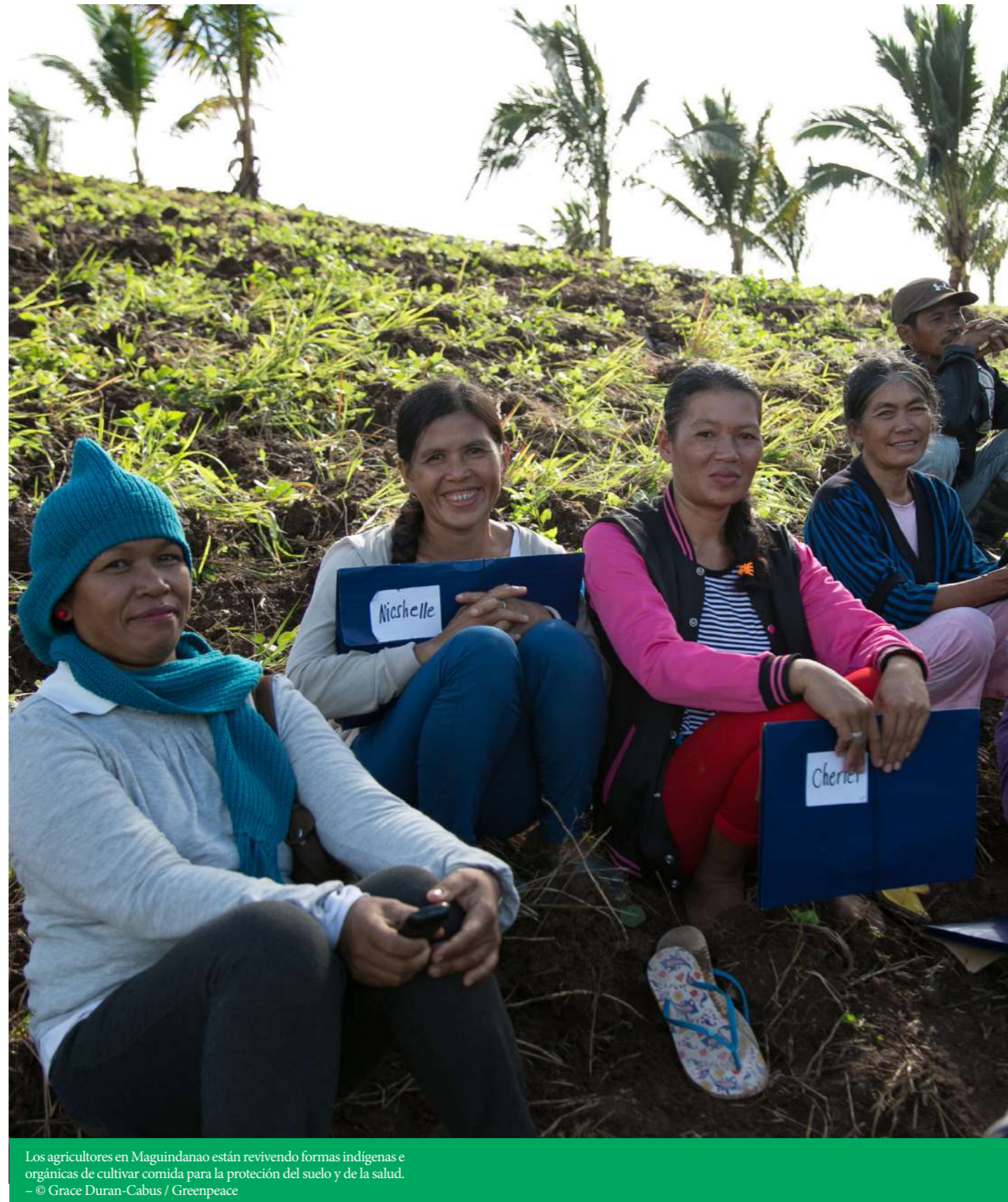
Los agricultores en Maguindanao están reviviendo formas indígenas e orgánicas de cultivar comida para la protección del suelo y de la salud.

1. Representación: el mayor número posible de miembros de la comunidad debe participar en la toma de decisiones.